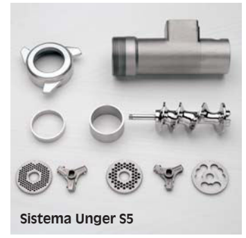
Sistema Unger S5