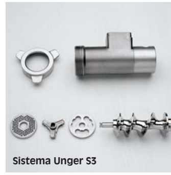
Sistema Unger S3